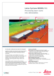
Leica Cyclone MODEL