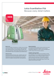
Leica ScanStation P16

Ilustrações, descrições e especificações técnicas não são associativos. Todos os direitos reservados. Impresso no Brasil – Copyright Leica Geosystems AG, Heerbrugg, Suíça, 2016. 835677pt-br – 03.17