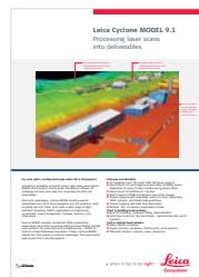
Leica Cyclone MODEL

Leica Geosystems AG leica-geosystems.com