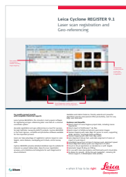
Leica Cyclone REGISTER