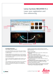
Leica Cyclone REGISTER