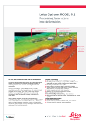
Leica Cyclone MODEL