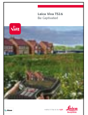
Leica Viva TS16