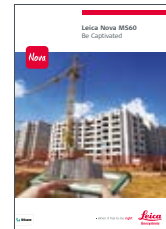
Leica Nova MS60