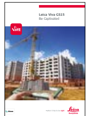
Leica Viva GS15