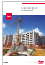
Leica Nova MS60

Abbildungen, Beschreibungen und technische Daten sind unverbindlich. Änderungen vorbehalten. Gedruckt in der Schweiz - Copyright Leica Geosystems AG, Heerbrugg, Schweiz, 2015. 836340de - 05.15 - INT