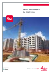
Leica Nova MS60

Az illusztrációk, leírások és műszaki adatok nem kötöttek. Minden jog fenntartva. Nyomtatva Svájcban – Szerzői jogok: Leica Geosystems AG, Heerbrugg, Svájc, 2015. 836351hu – 05.15 – INT